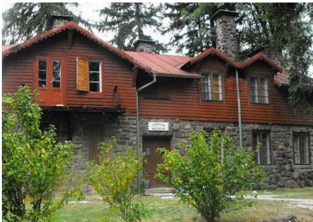
Podklady z obce

Ubytovacie zariadenia v obci sa nachádzajú Vila Kaštielik.