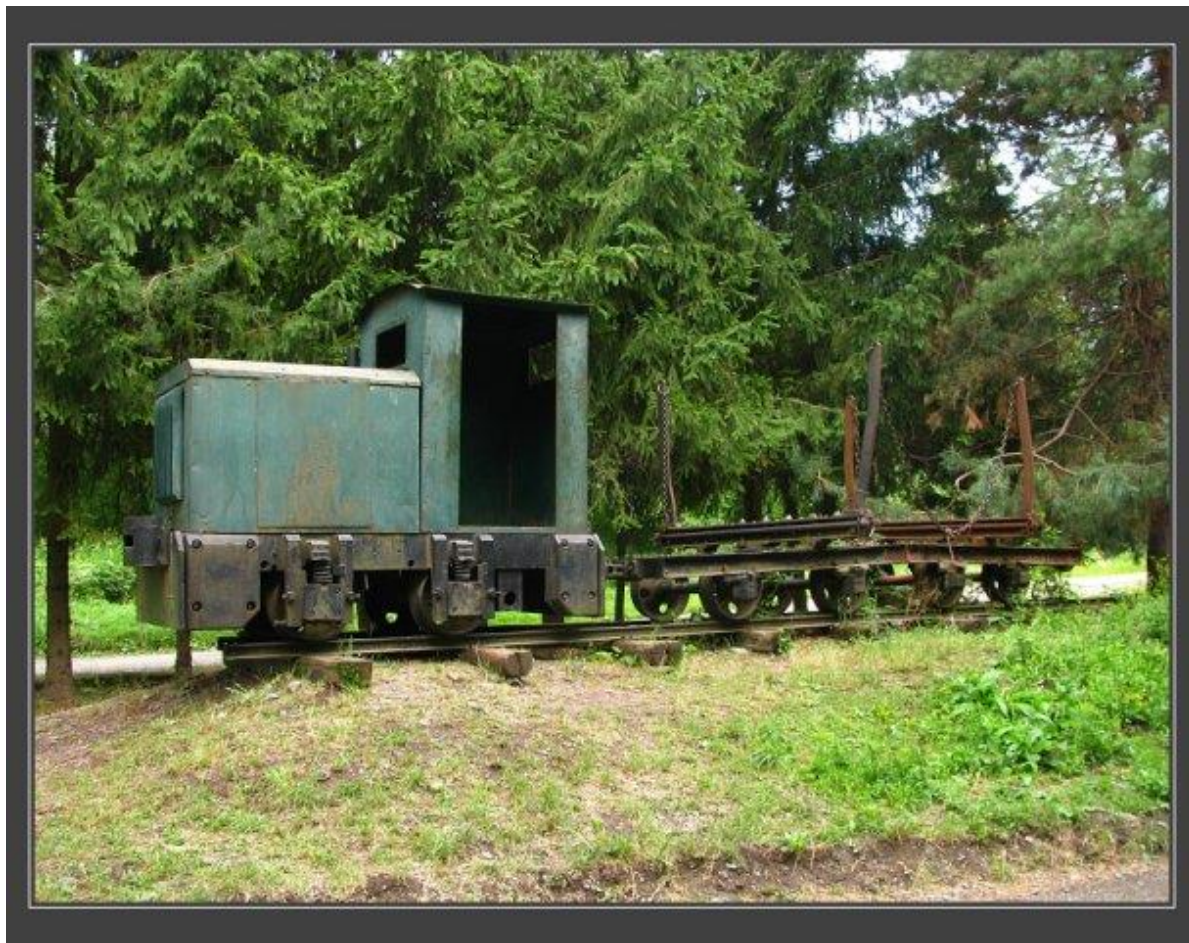
Podklady z obce